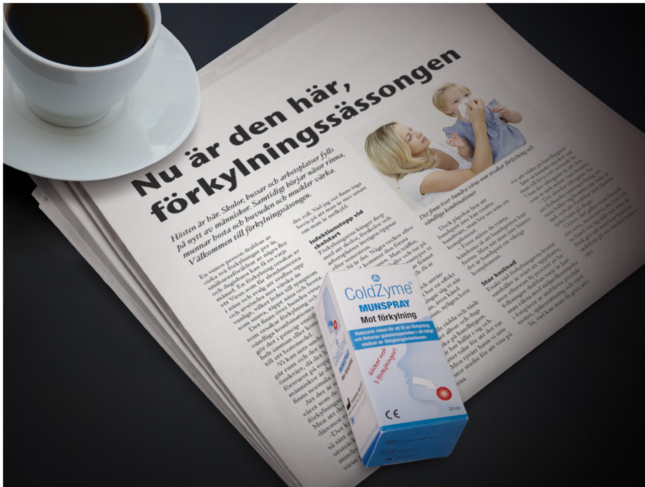
Kunskapen om ColdZyme Munspray hos allmänheten börjar nu sprida sig. Inte minst genom de markandskampanjer som genomfördes under hösten.