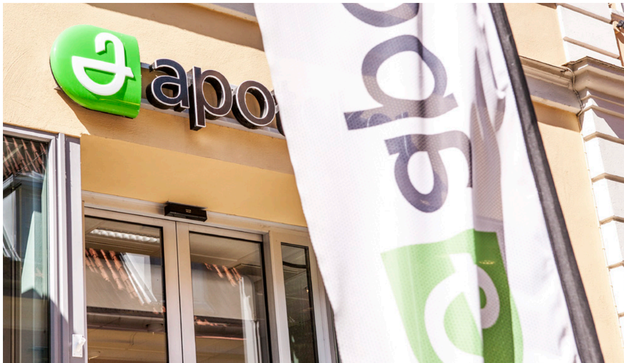
Nyligen tecknades avtal med Apoteket AB. Sedan tidigare finns avtal med Kronans Droghandel och Apotek Hjärtat.